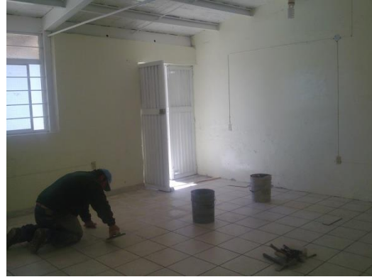
Remodelación en la Presidencia Municipal