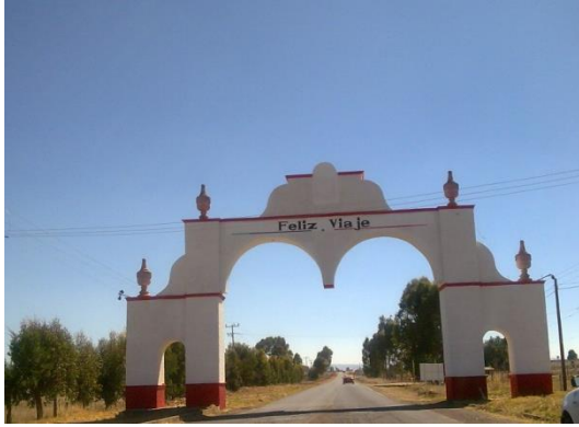
Conservación y mantenimiento del arco de entrada