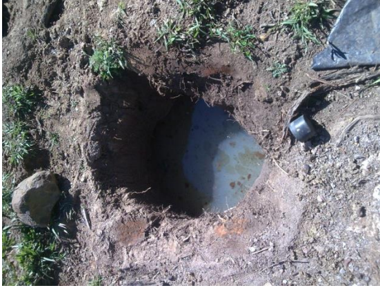
Pozo de Charcueros