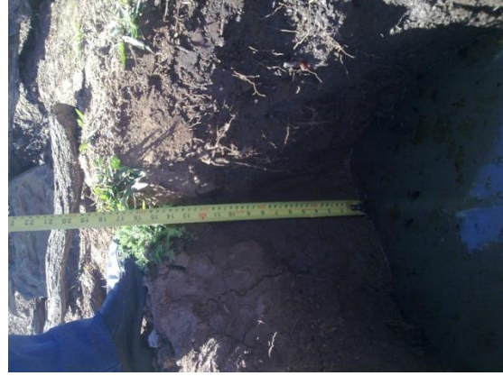
Al nivel de tierra 0.50cm