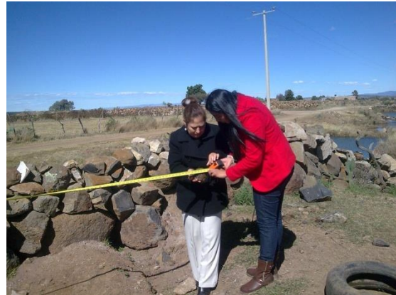
Al espejo de agua 4.20m