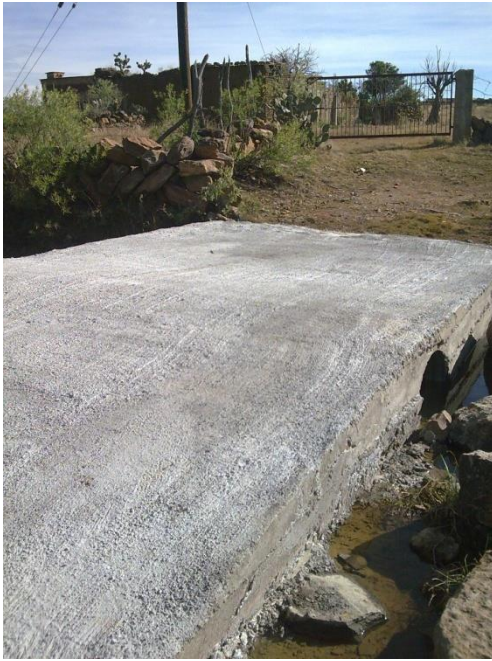
Vado en la comunidad del Durazno