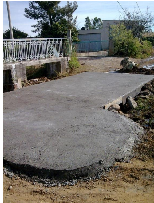
Vado en la comunidad del Durazno